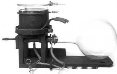
ห้องหมอก

ต่อมาในปี ค.ศ. 1936 ขณะเมื่อนักฟิสิกส์ชาวอเมริกันชื่อว่าคาร์ล ดี. แอนเดอร์สัน (Carl D. Anderson) ได้ศึกษารอยทางเคลื่อนที่ของรังสีคอสมิกด้วยห้องหมอก (cloud chamber) เขาบังเอิญพบรอยทางของอนุภาคที่มีมวลกลางๆ ระหว่างอิเล็กตรอนกับโปรตอน จึงเรียกมันว่า มิโซตรอน โดยคำว่า มิโซ เป็นคำภาษากรีกที่แปลว่า กลางๆ แล้วต่อมา มิโซตรอน ก็กร่อนลงมาเป็น มิซอน ต่อมาภายหลังก็มีคนอื่น ๆ ค้นพบอนุภาคอีกหลายชนิดที่มีมวลอยู่ในช่วงกลางๆ อย่างนี้ คำว่า มิซอน ก็ถูกใช้เรียกรวมๆ หมายถึงอนุภาคที่มีมวลอยู่ระหว่างอิเล็กตรอนกับโปรตอน