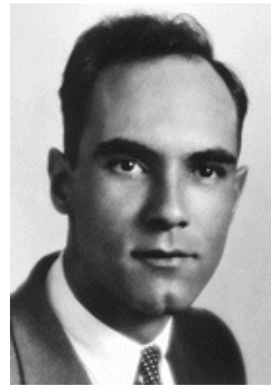
คาร์ล ดี. แอนเดอร์สัน

ต่อมาในปี ค.ศ. 1936 ขณะเมื่อนักฟิสิกส์ชาวอเมริกันชื่อว่าคาร์ล ดี. แอนเดอร์สัน (Carl D. Anderson) ได้ศึกษารอยทางเคลื่อนที่ของรังสีคอสมิกด้วยห้องหมอก (cloud chamber) เขาบังเอิญพบรอยทางของอนุภาคที่มีมวลกลางๆ ระหว่างอิเล็กตรอนกับโปรตอน จึงเรียกมันว่า มิโซตรอน โดยคำว่า มิโซ เป็นคำภาษากรีกที่แปลว่า กลางๆ แล้วต่อมา มิโซตรอน ก็กร่อนลงมาเป็น มิซอน ต่อมาภายหลังก็มีคนอื่น ๆ ค้นพบอนุภาคอีกหลายชนิดที่มีมวลอยู่ในช่วงกลางๆ อย่างนี้ คำว่า มิซอน ก็ถูกใช้เรียกรวมๆ หมายถึงอนุภาคที่มีมวลอยู่ระหว่างอิเล็กตรอนกับโปรตอน