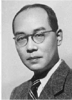
ฮิเดกิ ยูกะวะ