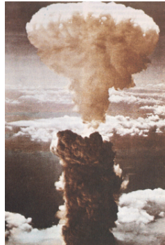
ระเบิดนิวเคลียร์ที่เมืองฮิโรชิมาและนางาซากิ

เมื่อช่วงทศวรรษที่ ค.ศ. 1920 นั้น อนุภาคที่มีขนาดเล็กกว่าอะตอมหรืออาจเรียกว่าอนุภาคย่อยของอะตอม (subatomic particles) ที่รู้จักกันก็คือ โปรตอน กับอิเล็กตรอน และเชื่อกันว่านิวเคลียสของอะตอมก็ประกอบขึ้นจากโปรตอนกับอิเล็กตรอน แต่โดยที่โปรตอนผลักกันเองและโปรตอนดูดกันกับอิเล็กตรอน จึงเชื่อกันว่าอิเล็กตรอนทำหน้าที่เหมือนกับกาวหรือซีเมนต์ที่เชื่อมโปรตอนกับอิเล็กตรอนให้เกาะกันเป็นนิวเคลียสได้ นี้เรียกว่าทฤษฎีโปรตอน-อิเล็กตรอน