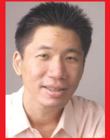
วิจัย กองสาสนะ