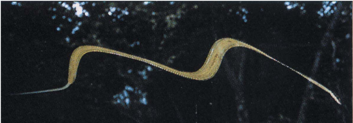
งู Paradise Tree Snake กำลังร่อนตัวไปในอากาศ