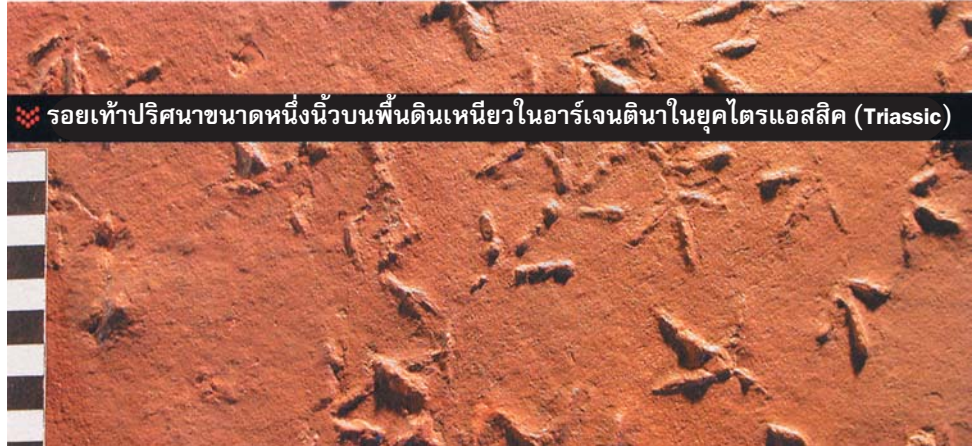
▼ รอยเท้าปริศนาขนาดหนึ่งนิ้วบนพื้นดินเหนียวในอาร์เจนตินาในยุคไตรแอสสิก (Triassic)

Melchor กล่าวว่า “พวกมันมีลักษณะเหมือนนก เราจะตั้งสมมุติฐานว่า พวกมันเป็นไดโนเสาร์แบบ theropod ซึ่งเป็นต้นตระกูลนกทุกชนิดรวมทั้ง Archaeopteryx ด้วย” เขาวางแผนจะ