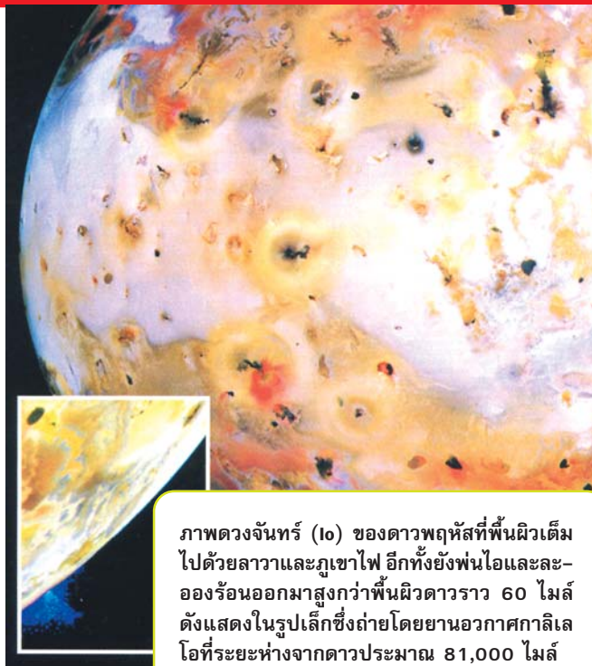
ภาพดวงจันทร์ (Io) ของดาวพฤหัสบดีที่พื้นผิวเต็มไปด้วยลาวาและภูเขาไฟ อีกทั้งยังพ่นไอและละอองร้อนออกมาสูงกว่าพื้นผิวดาวราว 60 ไมล์ ดังแสดงในรูปเล็กซึ่งถ่ายโดยยานอวกาศกาลิเลโอที่ระยะห่างจากดาวประมาณ 81,000 ไมล์

ผลงานที่น่าตื่นตะลึงที่สุดของยานกาลิเลโอ ได้แก่ การค้นพบมหาสมุทรน้ำเค็มใต้เปลือกดาวที่เป็นน้ำแข็งของดวงจันทร์ยูโรปา