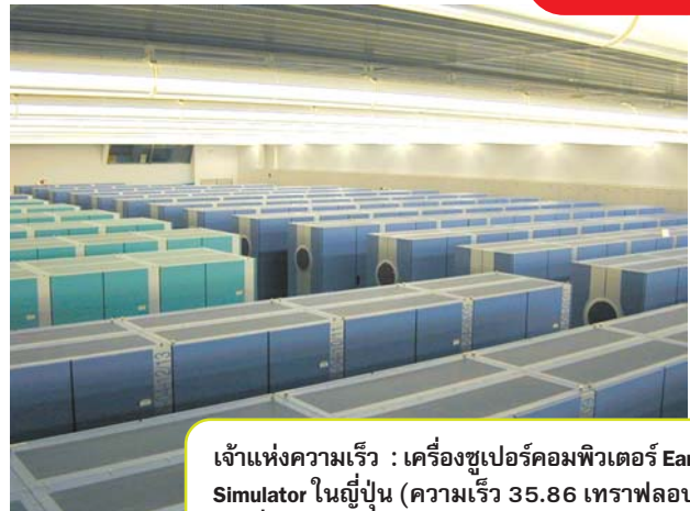
เจ้าแห่งความเร็ว : เครื่องซูเปอร์คอมพิวเตอร์ Earth Simulator ในญี่ปุ่น (ความเร็ว 35.86 เทราฟลอปส์ เร็วที่สุดในโลก)

เคลียร์ที่สหรัฐฯ เก็บไว้ ความเร็ว: 7.23 เทราฟลอปส์ เครื่องนี้มี อายุ 2 ปีแล้วและอยู่ในอันดับที่ 2 ในการจัดอันดับครั้งนี้แล้ว